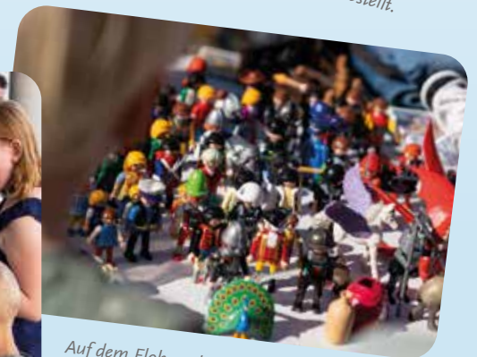
Auf dem Flohmarkt gab es 48 Flohmarktstände. Ich habe mir einen Panda gekauft..