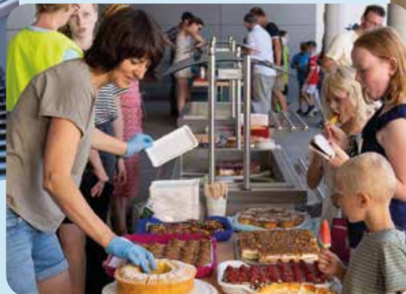
Beim Flohmarkt gab es viele unterschiedliche Essensvarianten. Es wurde alles selbst gemacht. Ich habe Crêpes mit Nutella gegessen – lecker! Es gab auch leckere Zuckerwatte und Cola-Eis.