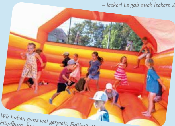
Wir haben ganz viel gespielt: Fußball, Basketball und auch auf der Hüpfburg. Es war ganz cool auf dem Schulhof zu spielen. Ich habe auch zugeguckt wie meine Schwester und mein Bruder Bungee-Run gemacht haben.