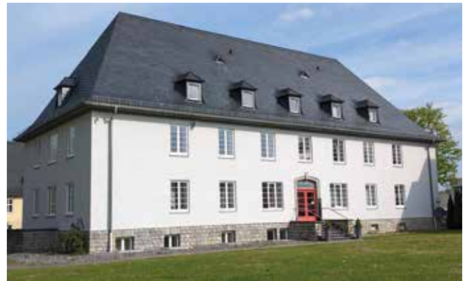
Neuer Standort in der Moritz-Rülf-Straße 1

Eigentlich wollten wir bereits vor Monaten die ersten Kinder willkommen heißen, nun hoffen wir auf Ende diesen Jahres oder