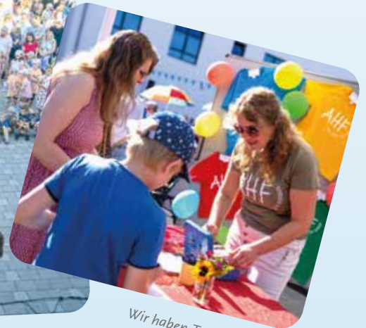
Wir haben T-Shirts bestellt.