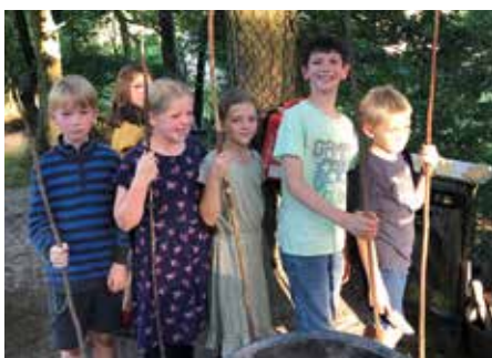
Bereit zum Aufspießen der Bratwürste