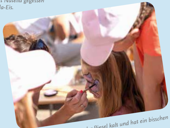
Beim Kinderschminken war der Pinsel kalt und hat ein bisschen gekitzelt. Man musste ein bisschen warten.