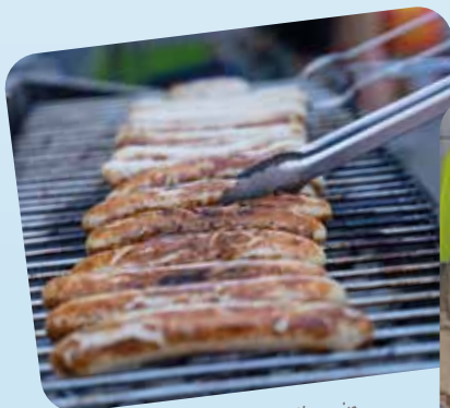
Der Grillstand war toll, weil mein Papa da gearbeitet hat. Es war da ganz heiß und die Männer haben um die 1.000 Würstchen dafür bestellt.