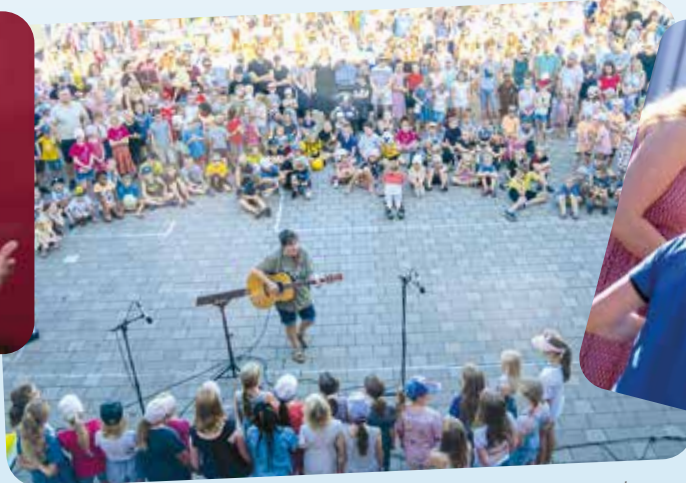
Am Anfang gab es eine schöne Begrüßung und danach 2 Lieder vom Chor.