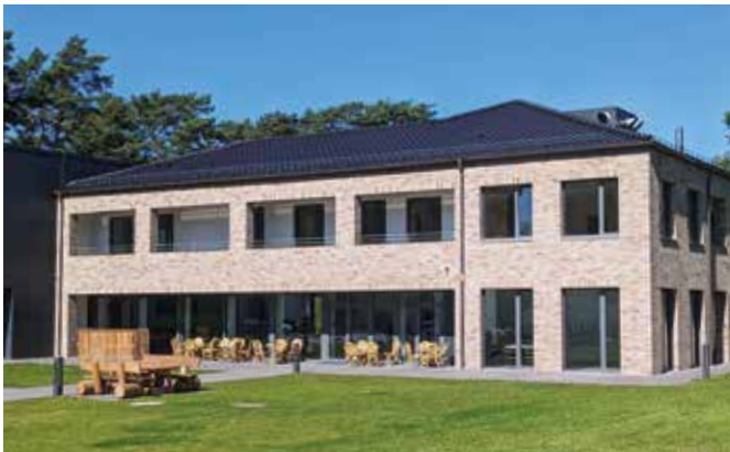
Wohngruppe „Windrose“ in Oerlinghausen

In dieser Ausgabe möchte ich gerne einen kurzen Rück- und Ausblick auf die Arbeit der AHF-Familienhilfe geben.